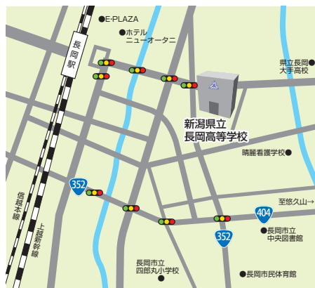
JR長岡駅から徒歩5分