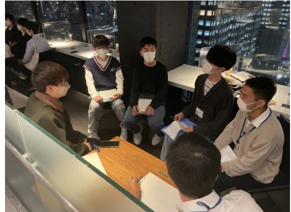
卒業生との懇談会の様子